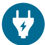
Tabela de cargas: